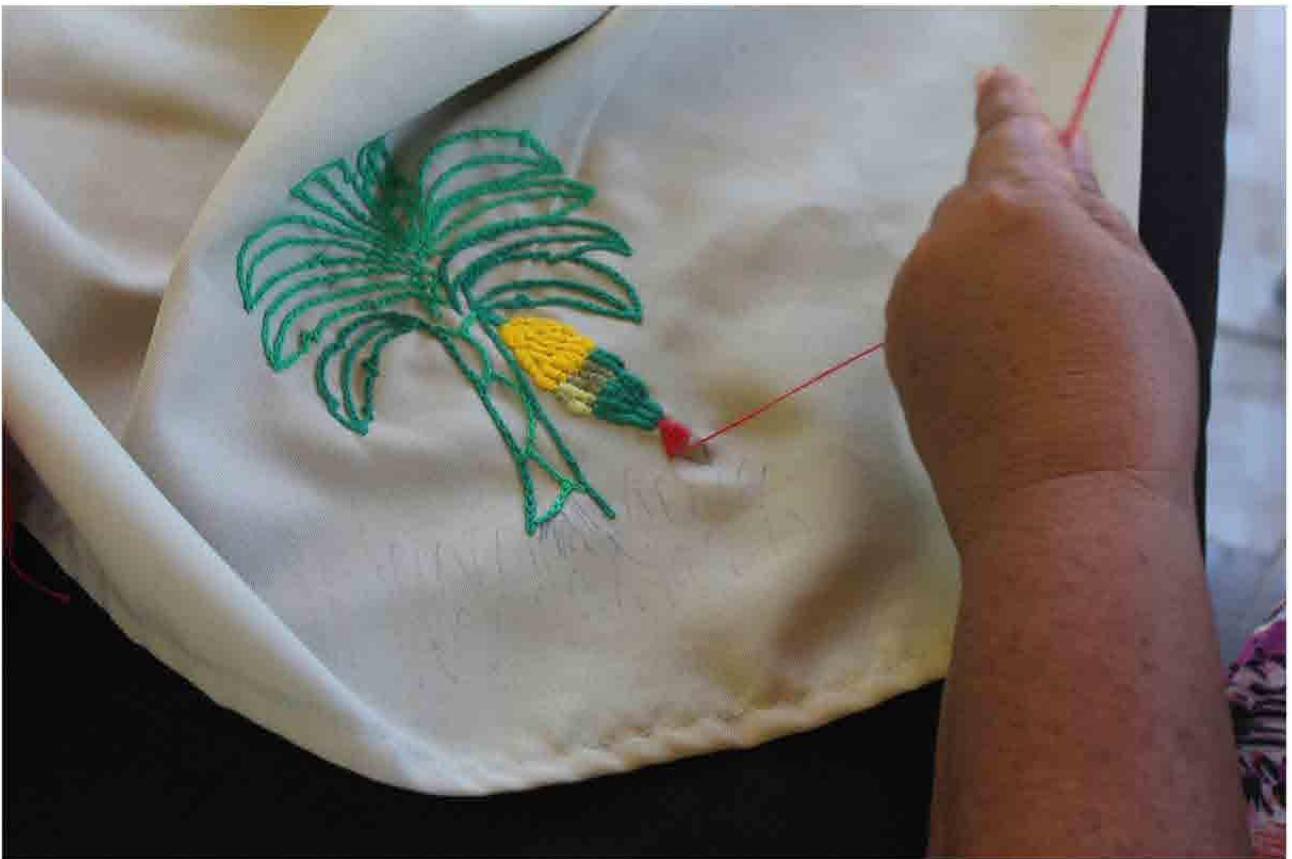
Ponto por ponto da bananeira bordada por Ivanilda. Oficina de fuxico em Mituaçu.