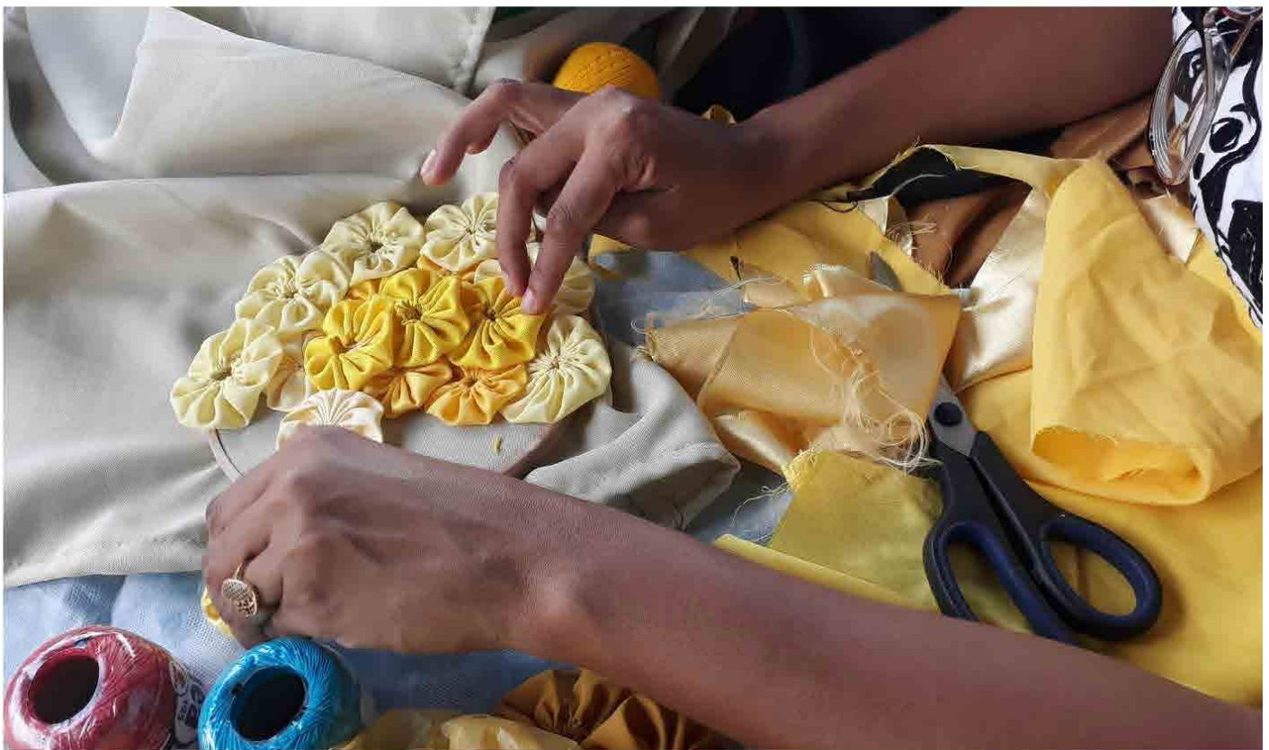
Sol de fuxico, feito coletivamente. Oficina de fuxico em Mituaçu. Fotos: acervo do projeto, 2019.