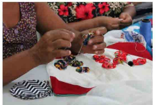
Linhas, agulhas e tesouras em ação. Oficina de fuxico em Mituaçu. Fotos: acervo do projeto, 2019.