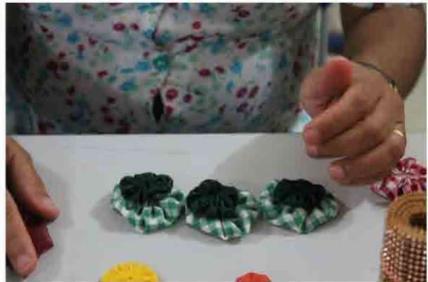
Montar, desmontar e fuxicar. Oficinas de fuxico na escola Ovídio Tavares de Moraes.