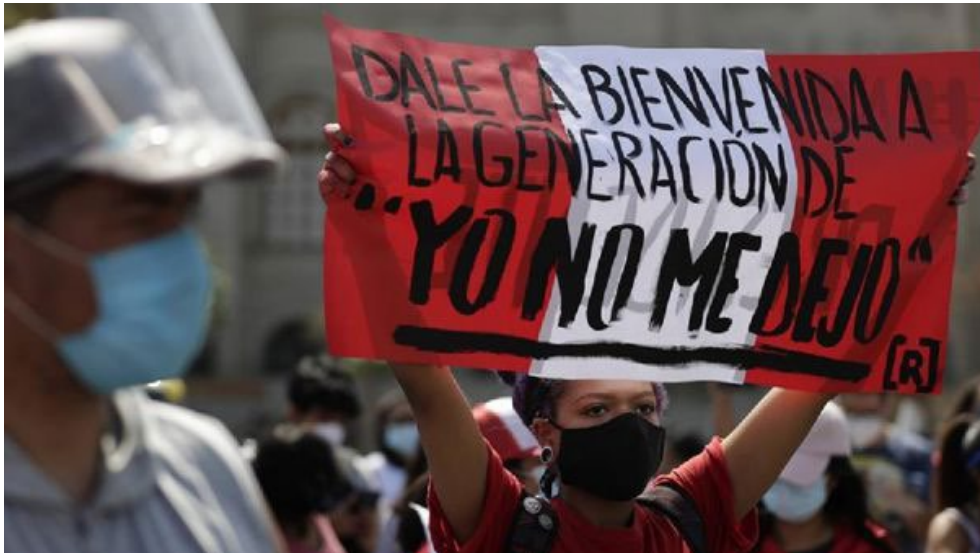
Figura 1 – Jóvenes reivindicando su identidad en términos generacionales que rompe los estereotipos anteriores que una generación que no se interesa por la política.

Foto: EFE Portal RPP Noticias [on line] 30 noviembre 2020 https://rpp.pe/politica/gobierno/la-generacion-del-bicentenario-que-rompio-el-cristal-y-derribo-al-gobierno-de-manuel-merino-noticia-1306984