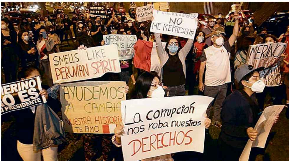
Figura 3 – La Generación del Bicentenario: ¡Se metieron con la generación equivocada! Carteles en inglés denotan una consciencia del ecosistema comunicacional dentro del cual se desarrolla su lucha y una intención de usarlo a favor de sus luchas

Así, este capitalismo cultural fragmentado transforma lo cotidiano haciendo uso del ecosistema comunicativo y la cultura visual imperante. Estos últimos se articulan entre sí, con la globalización y con la ausencia de meta-relatos que caracteriza a este modo de producción, propiciando nuevas formas de conocer y de habitar el mundo. Lo cotidiano así, se convierte en el espacio privilegiado para el despliegue de la subjetividad de los jóvenes permitiéndoles transformar su vivencia en existencia. Esto es posible en tanto que, según Zamora (2005), a la ausencia de meta-relatos ya señalada, se le suma la atomización social que caracteriza a las sociedades contemporáneas, produciendo en los jóvenes que las habitan, un sentimiento de desolación que los mueve a utilizar el aquí y ahora que lo cotidiano les brinda para aumentar sus experiencias y encontrarse con la alteridad. Solo así les es posible reconocerse y acercarse mutuamente (ver Figura 3).