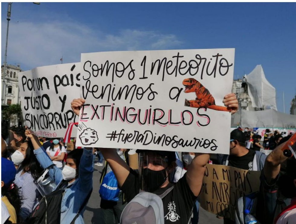
Figura 2 – Jóvenes protestan en la Plaza San Martín en Lima, contra los políticos tradicionales a quienes tildan de dinosaurios

exploración sobre el impacto del internet sobre la vida ciudadana de los jóvenes y sus formas de participación política (RAMÍREZ, 2015; ACEVEDO, 2015; MURO, 2016; CHÁVEZ, 2020). ¿Será que aquí en Lima todavía nos cuesta entender la dimensión cultural, social y política del impacto de lo tecnológico sobre la vida diaria y la ciudadanía? ¿Será que aquí en Lima nos cuesta entender que la construcción de sentido de la vida diaria y la ciudadanía en la sociedad contemporánea se desarrolla fuertemente mediada por los artefactos tecnológicos y la visualidad? Cabe señalar, sin embargo, que, a nivel latinoamericano, el debate contemporáneo sobre la participación juvenil sí es prolífico en estudios centrados en las nuevas subjetividades de los jóvenes que plantean nuevas formas de participación política, menos vinculadas al sacrificio y más próximas a la celebración, los medios, el uso de herramientas gráficas y comunicativas y lo lúdico (ver Figura 2).