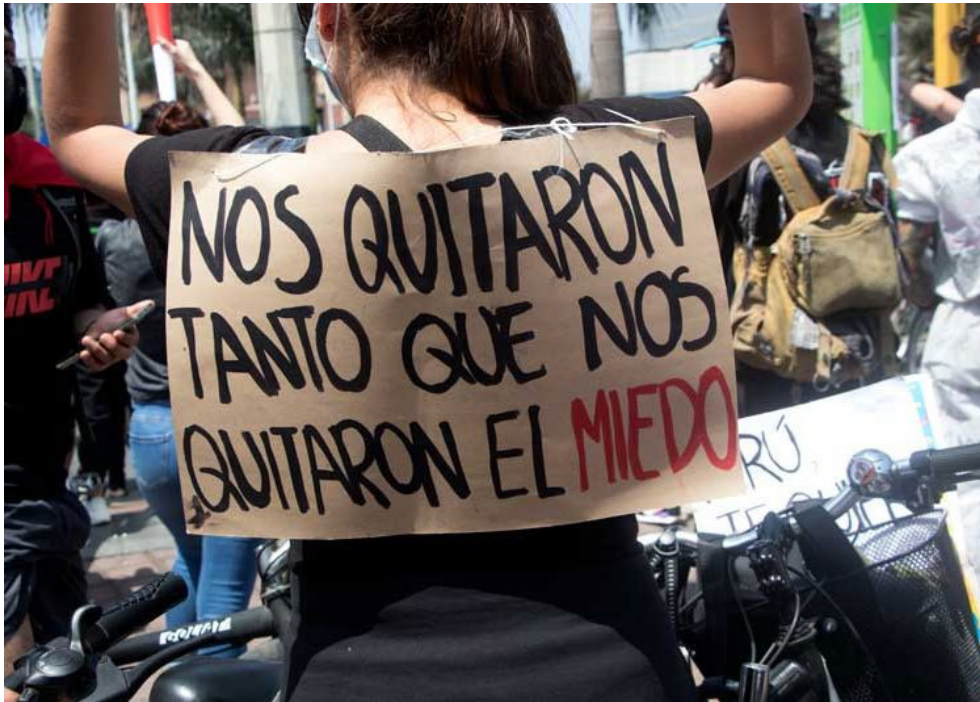
Figura 5 – Los carteles más que arengas reivindicativas en términos del poder central se enfocaban en transmitir un sentir y una forma de ver las cosas que los diferenciaba de los demás actores sociales.

Como toda producción humana, la política aspira a la legitimidad, pero a diferente de la ciencia y otras formas de acción humana que se confrontan, que no reducen su acción a sistemas socialmente generados, las políticas nunca se legitiman por los criterios que avalan las decisiones tomadas, sino por las producciones subjetivas que generan y las opciones de desarrollo que abren a la acción humana (GONZÁLEZ, 2012, p. 28).