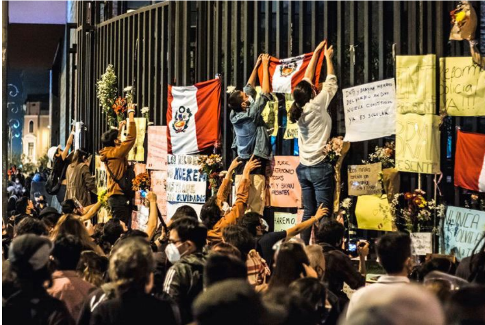
Figura 4 – Altar montado por los jóvenes con motivo de la muerte de Inti Sotelo y Bryan Pintado Fotos periodistas de la AFPP Diario El Peruano [on line] https://elperuano.pe/noticia/110137-lugar-de-la-memoria-prepara-exposicion-fotografica-la-generacion-del-bicentenario-en-marcha

diaria. Conuerdo con él, la repartición de lo sensible, que señala Rancière, implica que toda acción política es tanto una intervención como una lucha por lo sensible.