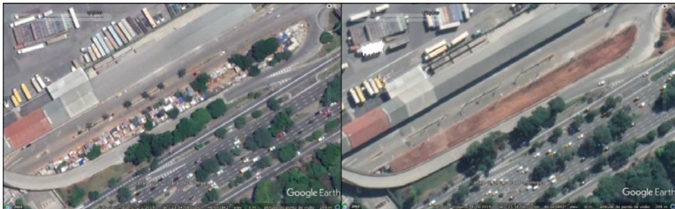
Figura 4: Desaparecimento da Favela do Cimento na comparação de série histórica de imagens de satélite entre 01.02.2019 (esquerda) e 18.04.2019 (direita)