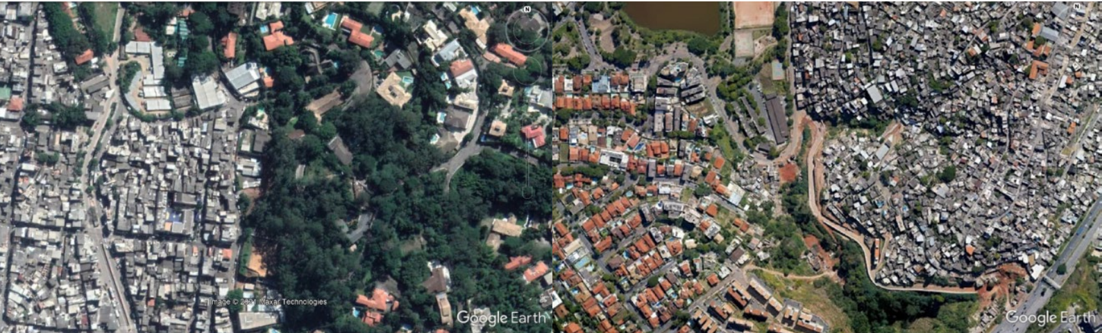
Figura 5: Paraisópolis e Morumbi (GOOGLE EARTH, 2020)

estrutural, dado a recorrência de oposições espaciais enquanto distinção social no caso favela x bairro (RIBEIRO, LAGO, 2001). A abrupta ruptura material entre Paraisópolis, cinza e angulosa, negra, comparada ao bairro do Morumbi, verde e sinuoso, branco, é patente na Figura 5 de 18.04.2019 (GOOGLE EARTH, 2020). Padrão semelhante pode ser visto entre o Morro do Papagaio e a Vila Paris, em Belo Horizonte, na Figura 6 de 15.05.2018 (GOOGLE EARTH, 2020).