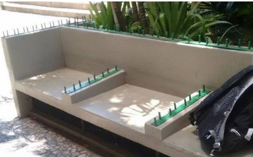
Figura 2: Banco “antimendigo” em Curitiba (TRIBUNA, 2020)

É claro que estas coisas impactam brancxs pobres, mas quando as estatísticas mostram que a população negra representa a maioria da população de rua, assim como mulheres negras são 3,9 das 4 milhões de pessoas negras em serviço doméstico, de um total de 6,2 milhões (PINHEIRO, LIRA, REZENDE, FONTOURA, 2019, 12), e que um homem negro morre pela violência policial a cada 23 minutos no país (RIBEIRO, 2019, 94), percebe-se como a cidade materializa questões raciais e faz a manutenção diária do privilégio de quem tem onde dormir.