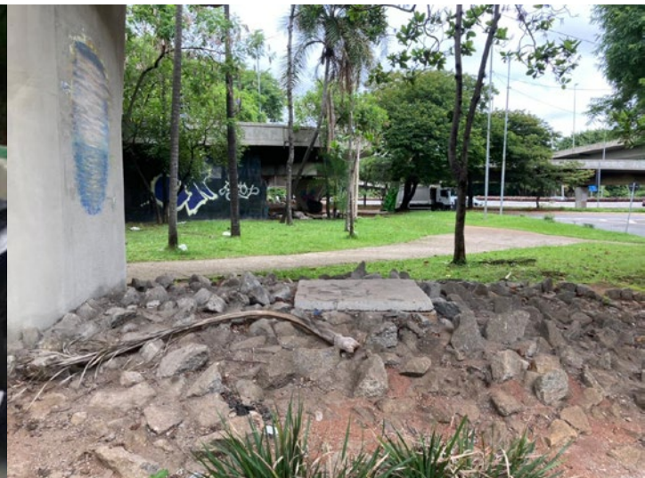
Figura 3: Estruturas “antimendigo” em viaduto de São Paulo