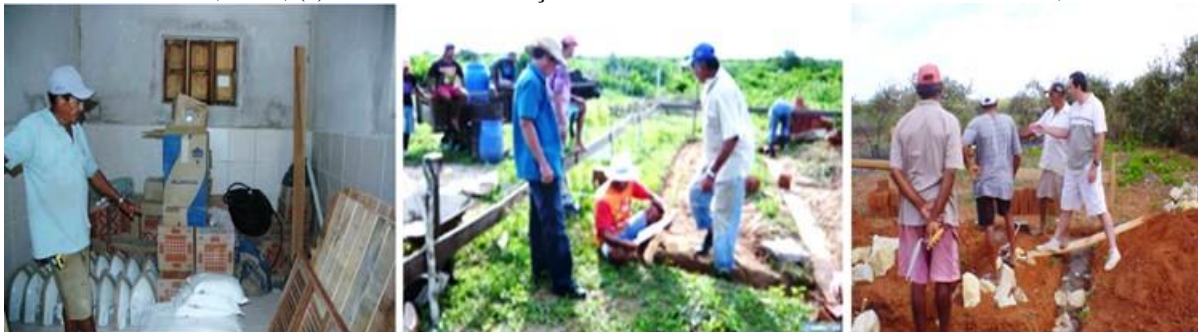
Figura 05: Processos construtivos em mutirões assistidos pelo GERAH: (a) Almojarifado do Mutirão de reforma das moradias do Assentamento Rosário, 2009; (b) Mutirão de construção de moradias do Assentamento Roseli Nunes, 2009; (c) Mutirão de construção das moradias do Assentamento Maria da Paz, 2004.

Com a concepção e a construção em mutirão do Assentamento Maria da Paz, conduzidas pelo referido grupo, em parceria com o Movimento e o INCRA, inicia-se a concepção do método de intervenção “O Desenho do Possível” (BORGES, 2006), delineando o trabalho de planejamento para assentamentos de habitat concentrado, coordenados pelo MST especialmente no Nordeste, contribuindo com a inserção do arquiteto e urbanista no meio rural.