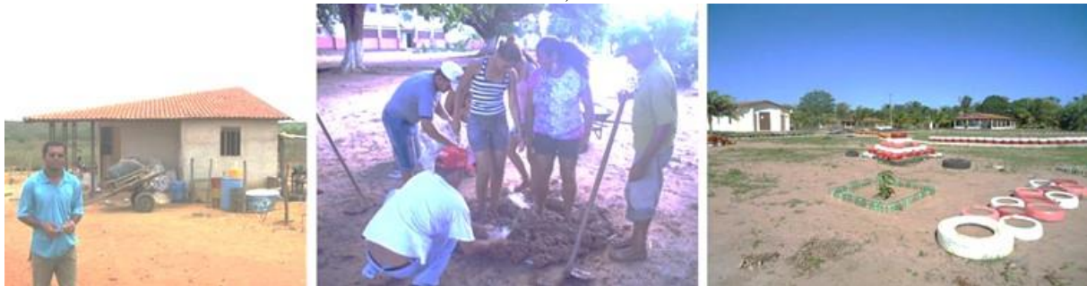
Figura 02: (a) Casa do assentamento Maria da Paz, João Câmara/RN, 2005; (b) Mutirão de confecção de adobes no Centro de Formação e Capacitação do MST no RN, 2008; (c) Praça do Assentamento Rosário, Ceará Mirim/RN, 2013.

O GERAH, além de assessorar o MST, trabalha na formação de profissionais para que possam atuar na assessoria técnica a movimentos sociais, sobretudo os do campo. Relaciona o ensino na graduação e pós-graduação à pesquisa e à extensão, estudando os habitats do campo, associando o conhecimento tecnológico ao filosófico e social. Nesse sentido, suas ações dizem respeito ao planejamento físico-ambiental de assentamentos, à implantação de seus habitats – compreendidos enquanto espaços onde predominam a moradia, a educação e a vida cotidiana do coletivo ali sediado – bem como a elaboração compartilhada de projetos e a gestão da construção das moradias e/ou de seus espaços livres públicos em processos de mutirão assistido (Figura 02).