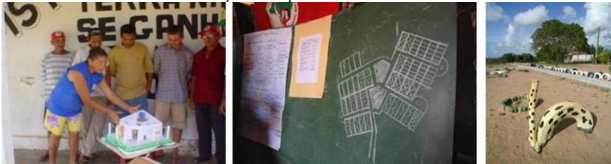
Figura 09: (a) Apresentação da maquete da moradia do Assentamento Maria da Paz/RN pelos próprios assentados; (b) Assembleia para planejamento do mutirão no Assentamento Roseli Nunes; (c) Apropriação das técnicas de construção de brinquedos no Assentamento Rosário/RN.

Atualmente, percebe-se que o Movimento alcança a autogestão na produção de sua habitação social a partir da apropriação dos conhecimentos técnicos adquiridos em colaboração com os poucos grupos de assessoria técnica universitária e de organizações não governamentais (Figura 09).