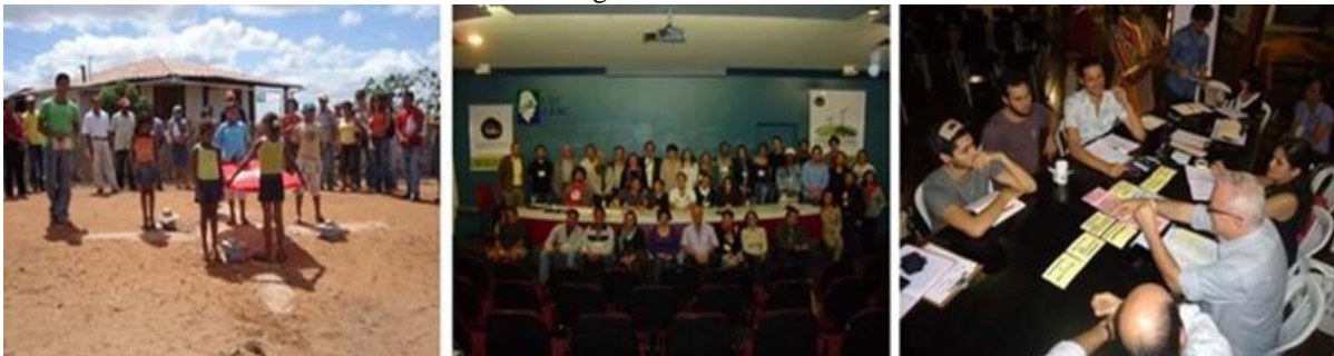
Figura 08: (a) Mística de militantes do MST durante o I Colóquio Habitat e Cidadania: habitação de interesse social no campo; (b) Finalização dos trabalhos no II Colóquio Habitat e Cidadania: habitação de interesse social no campo (c) Grupo de discussão do III Colóquio Habitat e Cidadania: habitação de interesse social no campo, nas águas e na floresta.

Em conjunto, os eventos discutem, essencialmente, a importância de atualizar e aprofundar o debate sobre o problema habitacional rural, nas águas e na floresta, delineando encaminhamentos e possibilidades para o enfrentamento da questão. Consideram as necessidades dessas formas de habitat rural, contemplando os interesses das comunidades, que debatem e defendem sua visão de mundo.