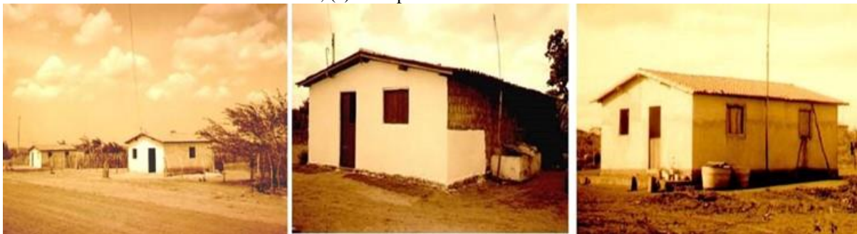
Figura 04: (a) Casa padrão do INCRA no Assentamento Santa Vitória/RN, 1999; (b) Casa padrão do INCRA no Assentamento Zabelê/RN; (c) Casa padrão do INCRA no assentamento Xoá/RN.

Quanto à concepção do projeto da moradia, o Estado utiliza um projeto padrão para todo o país (Figura 04), não respeitando as especificidades das condições locais nem os hábitos e as necessidades das famílias contempladas.