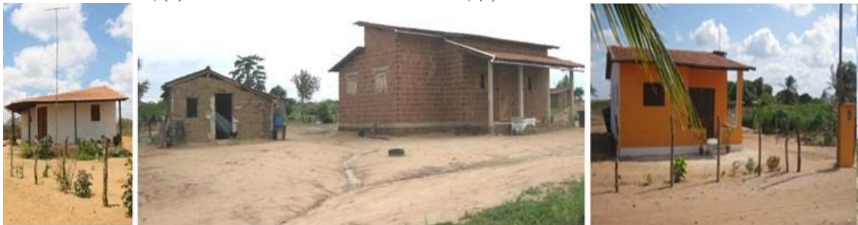
Figura 07: Moradias construídas em regime de mutirão assistido pelo GERAH: (a) Casa no Assentamento Maria da Paz; (b) Casa no Assentamento Roseli Nunes; (c) Casa no Assentamento Bernardo Marim.