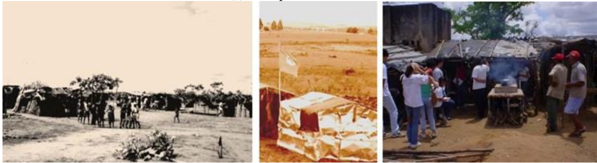
Figura 03: (a) Acampamento do MST numa propriedade privada em João Câmara/RN, 1998; (b) Acampamento do MST em Itaberá/SP, 2000; (c) Acampamento Maria da Paz, João Câmara/RN, 2001.