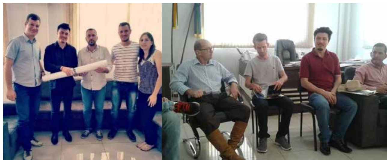
Figura 4 – Ato Oficial de Entrega. Fonte: BRUM (2018). Figura 5 – Definições de diretrizes. Fonte: BRUM (2018). Quadro 2 – Etapas WIUU. Fonte: Autores (2021).