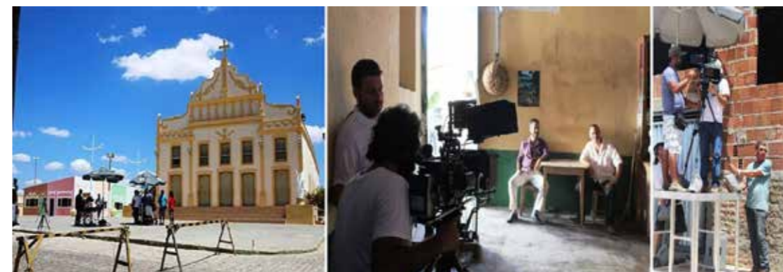
Figura 18 - Comparação entre os cenários durante e depois da procissão (São João do Cariri). Fonte: Acervo da pesquisa (Vanessa Daltro, 2016). Figura 19 - Equipe de produção no Set de filmagens (São João do Cariri). Fonte: Acervo da pesquisa (Vanessa Daltro, 2016).

prefeitura. Esses dois eventos fomentam o comércio da cidade, que além de visitantes e fiéis, recebe muitos ambulantes e vendedores da região que veem nas festas uma oportunidade de garantir algum lucro.