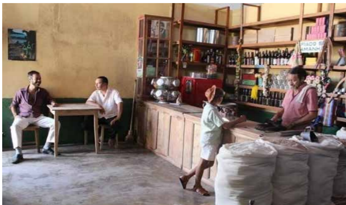
Figura 14 - Cenografia da bodega (São João do Cariri).

Algumas intervenções tiveram que ser feitas, como por exemplo, no meio-fio e na parte inferior do tronco das árvores, que estavam pintados de branco e foram pintados com uma tonalidade esverdeada, para que facilitasse os efeitos de pós-produção (Figura