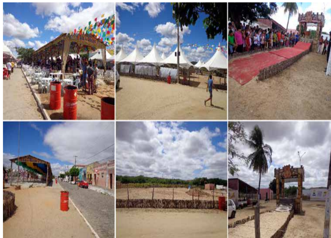
Figura 17 - Comparação entre os cenários em época de festa e em dias comuns na cidade de Cabaceiras-PB.

identidade local compartilhada. De acordo com a pesquisadora, “as festas, por revelarem novas possibilidades para os espaços coletivos, podem motivar transformações mais permanentes do que as inerentes à sua própria temporalidade” (FONTES, 2013, p. 192). Para melhor compreensão das atmosferas criadas é necessário que tenhamos um olhar voltado aos usos e apropriações de cada lugar tanto em dias ordinários como festivos.