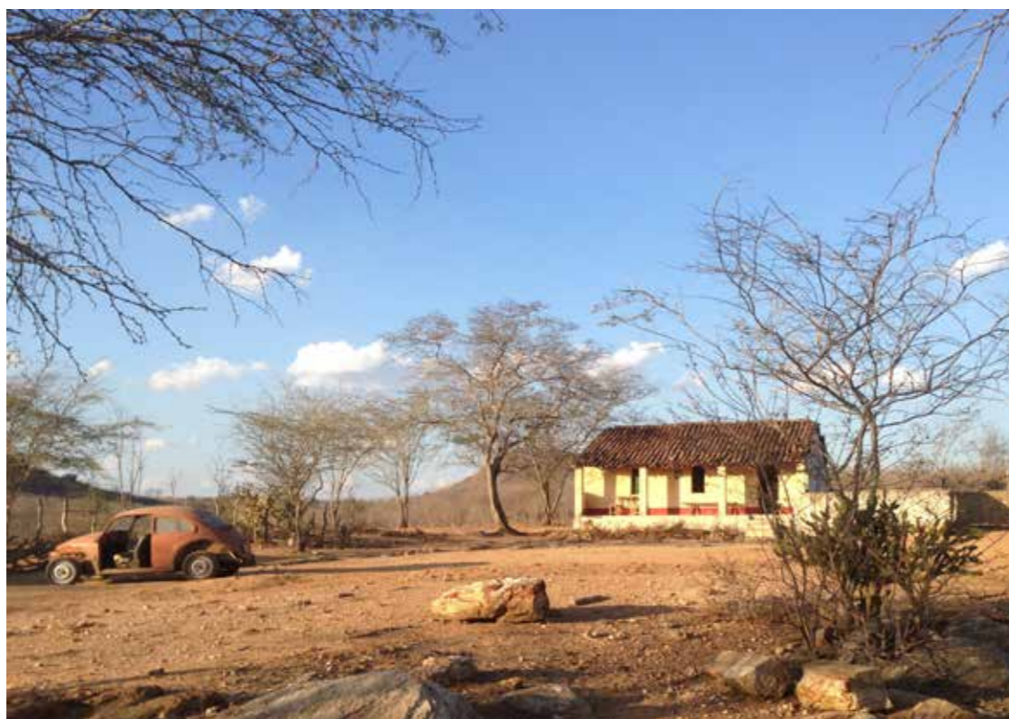
Figura 15 - Casa utilizada para compor o cenário do filme Beijo de estrada (zona rural de Cabaceiras-PB). Fonte: Acervo da pesquisa (Alberto Araújo, 2016).

cidade, como parte dos cenários do filme Beijo de Estrada , se deu em função do cenário que já existia no local, a população de São João, no geral, recebeu a notícia com grande entusiasmo. Nos cenários escolhidos, destacam-se a Igreja, o antigo Casarão dos Árabes, atual sede do IHGCP — Instituto Histórico e Geográfico do Cariri Paraibano, a Escola Pública Deputado Tertuliano de Brito, e o interior do Mercado Público, onde foi construída a cenografia da bodega. Como a história do filme se passa nos anos 70, foi necessário estudar o enquadramento ideal, para que alguns elementos como torres de energia, postes e cabeamentos de luz, não fossem vistos, de forma a diminuir os custos com pós-produção e correção de imagens.