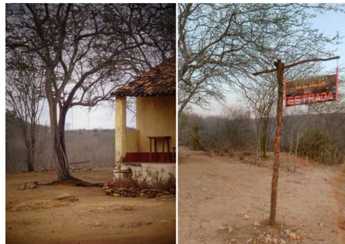
Figura 16 - Cenário natural e inserções de elementos cenográficos.

13). No mais, a parte que despendeu maior tempo, gastos, estudo e mão de obra, foi a cenografia da bodega, no interior do antigo Mercado Público, que foi reservado para ser o museu da cidade (Figura 14).