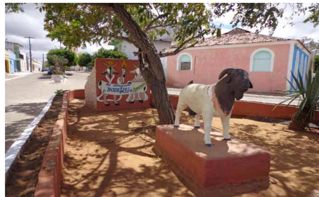
Figura 9 - Escultura do Bode Rei.

é fruto da ação humana mediante elementos naturais e artificiais (SANTOS, 1994). Através da observação dos espaços da cidade, é possível perceber como o meio urbano interage com seus habitantes, ao passo que sofre modificações ao longo do tempo. Referindo-se à Cabaceiras, pode-se encontrar uma intrínseca relação entre as variadas inserções de elementos cenográficos em seu espaço como tentativa de evidenciar o caráter espetacular.