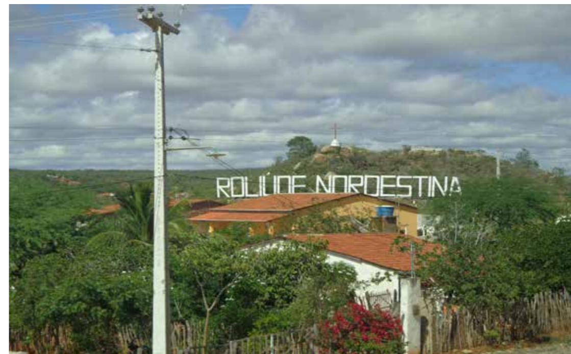
Figura 8 - Letreiro - Roliúde Nordestina.

Partindo da premissa de que o espaço é considerado como um conjunto indissociável, no qual participam objetos geográficos, naturais e sociais, sua produção e representação