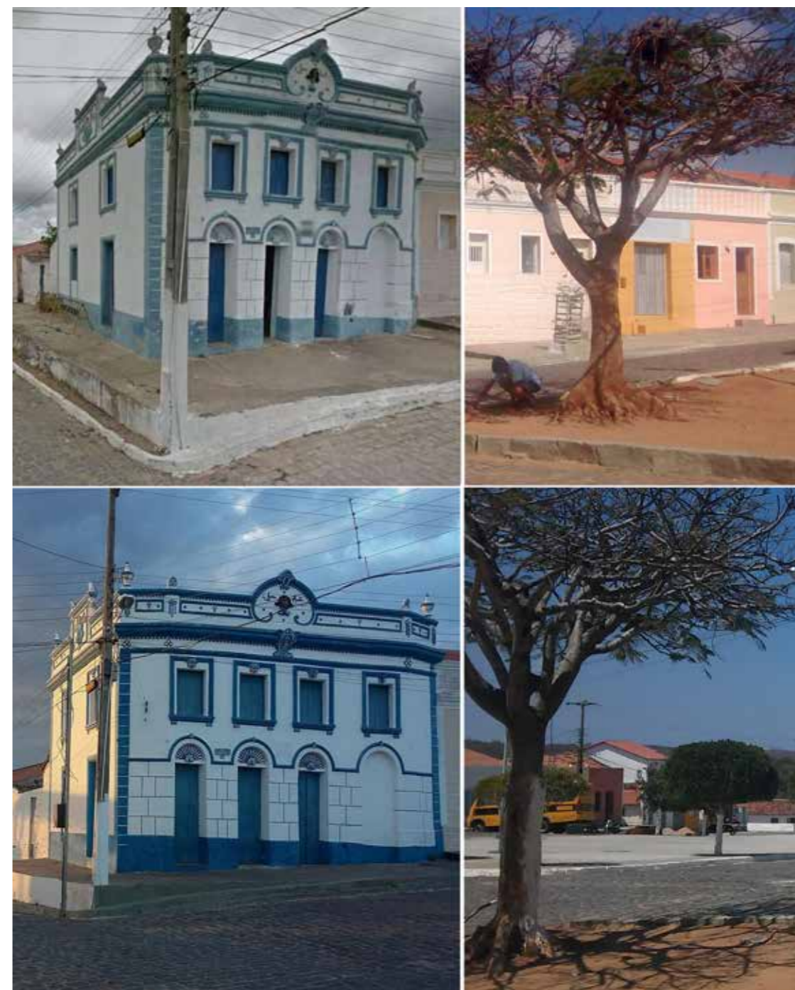
Figura 13 - Pequenas intervenções no cenário urbano para uso cenográfico (São João do Cariri).

agenciador , o qual territorializa novas subjetividades e reinventa um cotidiano espetacularizado, ao mesmo tempo em que é significativo de memória. Na perspectiva do referido autor, “a primeira relação do artefato com o espaço urbano se dá pela sua capacidade de transformação do lugar, pelo poder de dissimulação da realidade, através da transfiguração espacial” (ROLIM FILHO, 2013, p. 45). O mesmo fato acontece durante a festa do Bode Rei, quando a cidade é decorada com portais e outros elementos que fazem alusão a réplicas de castelos e muradas reais (Figura 12). Neste segundo exemplo, apesar de referir-se a elementos temporários em sua maioria, o que difere do artefato supracitado, que é permanente, a cenografia funciona como um elemento que absorve uma cultura desenvolvida pela cidade em um contexto festivo de alusão a honra atribuída ao bode. Trata-se, portanto, de elementos efêmeros, mas, com implicações diretas na construção de um imaginário local.