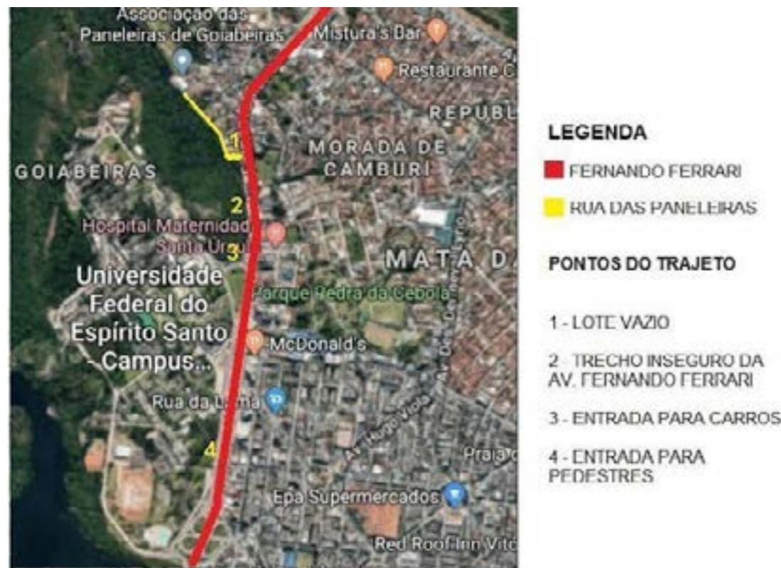
Figura 6: Mapa de locais por onde passo no trajeto casa x UFES.

Ao analisar o meu deslocamento nos últimos anos da faculdade, ainda deparo-me com outros problemas inerentes à cidade, que podem ser apontados como barreiras para uma mulher. Nos últimos anos morei no bairro de Goiabeiras, bem próximo à UFES. Apesar das vantagens que existem em se morar próximo ao seu ambiente de estudo, com o intuito de economizar, eu muitas vezes optava por ir à UFES a pé. Para isso, é necessário passar pela Avenida Fernando Ferrari, uma importante via arterial da cidade em que os carros passam em alta velocidade e o fluxo é intenso.