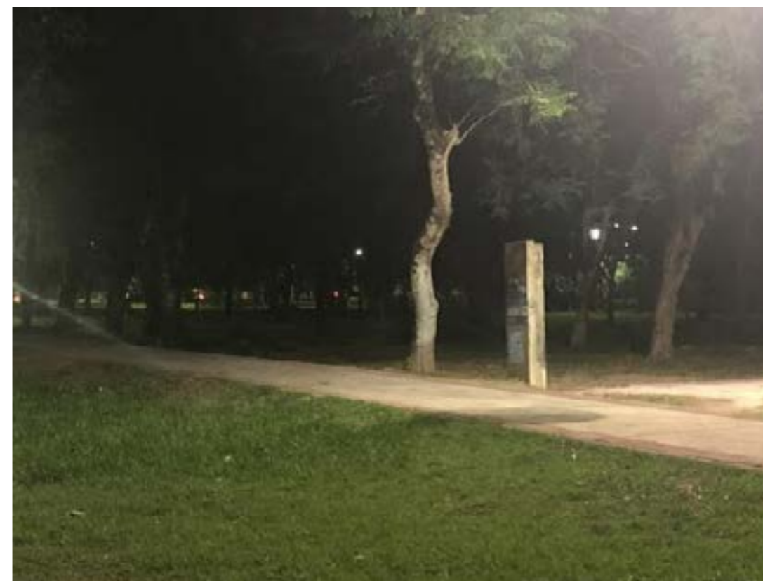
Figura 4 : Bosque atrás do prédio do Mestrado em Arquitetura e Urbanismo a noite

De longe, avistei que o deck na frente da edificação foi desmanchado, adentro, a cantina também não existia mais, dando lugar a grandes mesas onde alunos se reúnem com seus notebooks para a realização de trabalhos estudantis. O pátio continua o mesmo, agora com um balanço. Percebo um ar de desconfiança. Em observações na frente do Cemuni III, mulheres sozinhas estão somente de passagem, com passos apressados e firmes; mulheres acompanhadas de outras mulheres andam com mais calma, porém a todo momento observando ao redor, atentas a um possível perigo