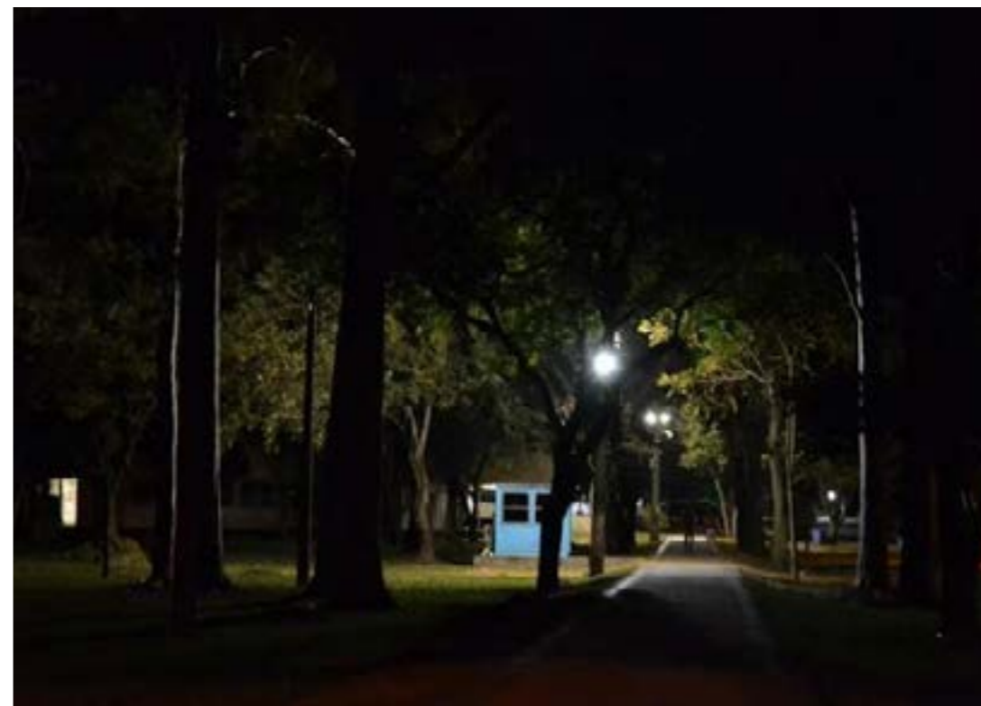
Figura 10: Caminho que começa em uma das entradas para pessoas da UFES. Trecho onde uma mulher sofreu uma tentativa de estupro.

Ao adentrar o espaço do Cemuni III, nos deparamos com o problema de salas insuficientes para os alunos fazerem os seus projetos, além de uma carência de