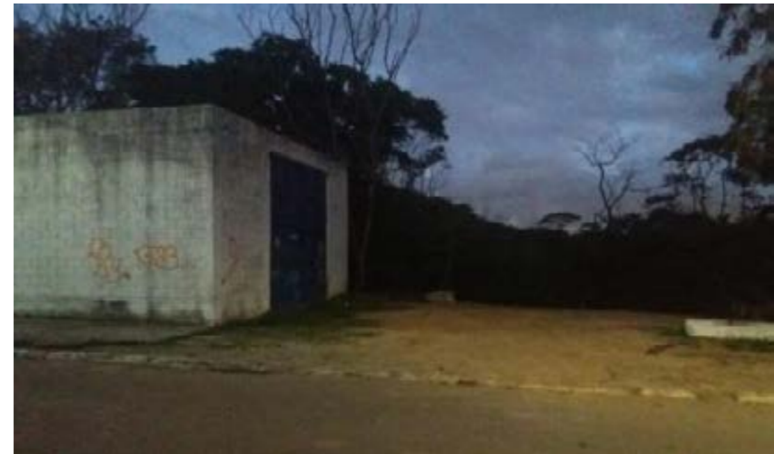
Figura 7: Lote vazio que antecede a rua das panelleiras, o lote é tangenciado por essa construção e é um ponto que durante a noite também me causa insegurança. Esse ponto é voltado para o mangue de Goiabeiras, área verde de enorme potencial paisagístico.

Ponto 1: encontra-se próximo à intersecção entre a Avenida Fernando Ferrari e a rua das panelleiras. Trata-se de um lote vazio, escondido por uma construção antiga, cercado por dois lados pelo mangue e tangenciado pela rua das panelleiras (que leva até o Galpão das Panelleiras, ponto turístico muito importante de Vitória). Passar pelo local me deixa um pouco insegura, mesmo pela manhã. A área deveria receber um maior investimento, uma vez que tornaria a rua de acesso ao Galpão das Panelleiras mais convidativa, mas, como pode ser visto na foto, isso não é feito.