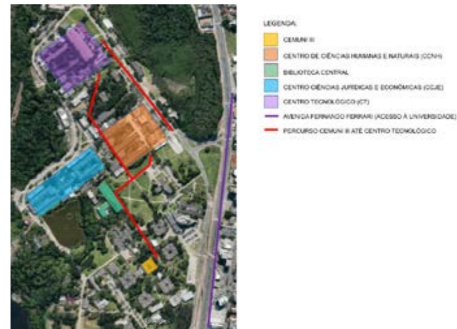
Figura 1: Mapa da Universidade e entorno.