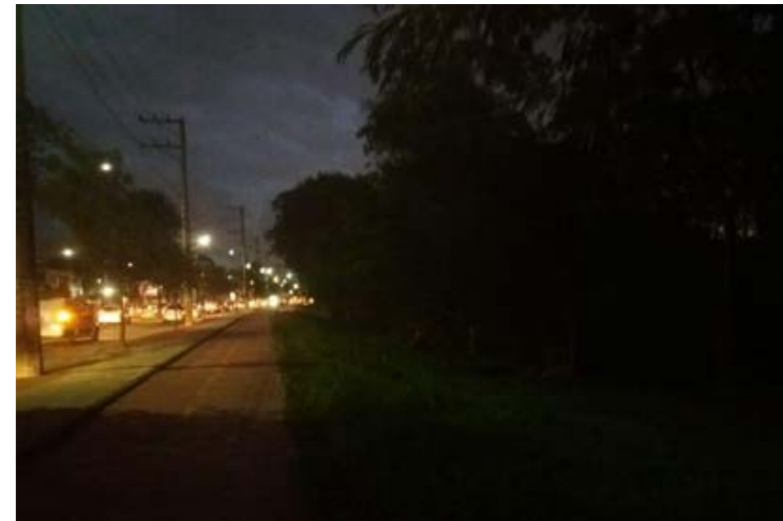
Figura 8: Trecho da Fernando Ferrari ligando o restante do bairro de Goiabeiras a UFES. Ao lado esquerdo temos uma via arterial de fluxo intenso e com duas vias. Ao lado direito temos uma densa vegetação. Fonte: Acervo pessoal, 2019.