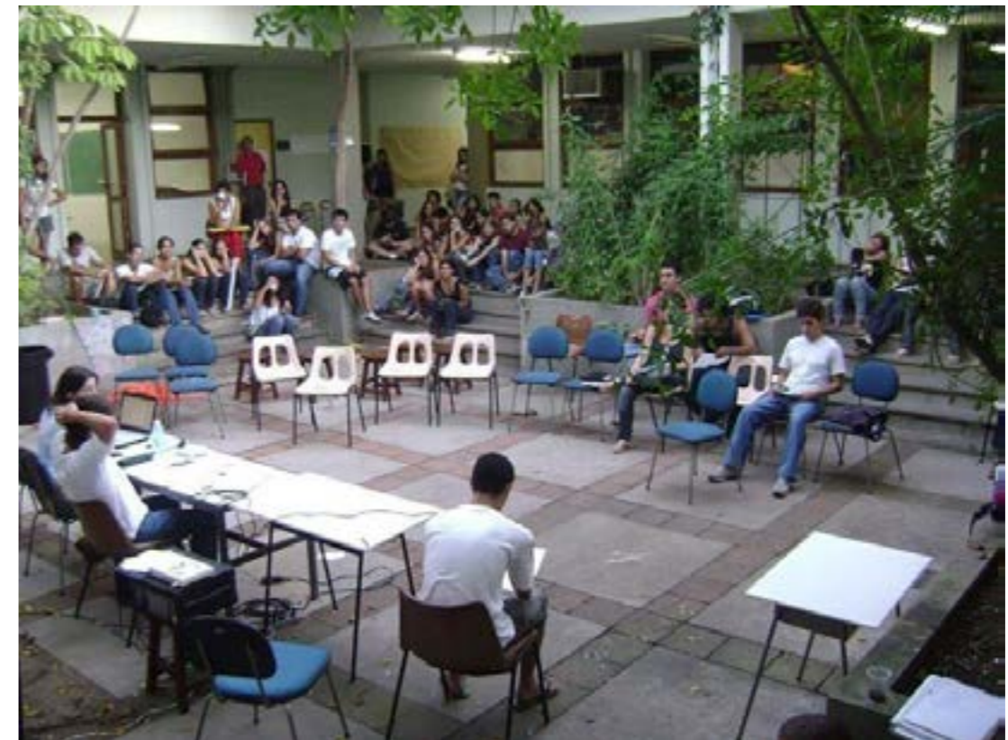
Figura 5: Alunos participando de uma Assembleia no Cemuni III. Ano, 2014.

Tenho 27 anos, ingressei em arquitetura na UFES no ano de 2012, com 21 anos. Cursei boa parte do meu ensino médio e fundamental em escolas públicas. Venho de uma família de classe C, sou filha de pais separados e morava com minha mãe, pessoa que foi responsável pela maior parte da despesa de seus filhos. Nos primeiros anos como universitária eu mantinha uma relação muito diferente com o espaço do Centro de Artes e dos prédios pelos quais eu transitava. Sobre essa mudança de relação com o espaço, acho relevante para este artigo destacar: a somatização de momentos de muita pressão que os universitários acabam enfrentando e uma mudança que observei no espaço físico.