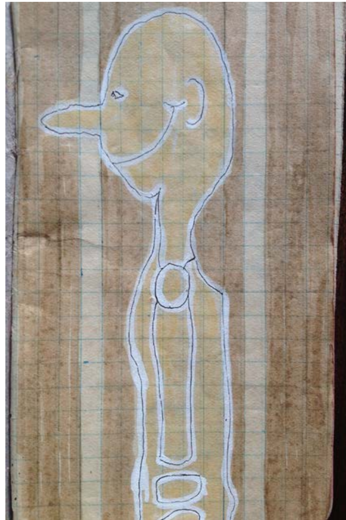
Imagem 1: Desenho retirado de sketchbook de Lídia.