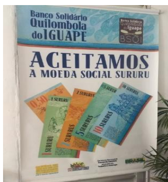
Figura 2: Moeda Sururu – Banco BSQI