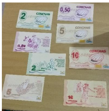
Figura 1: Moeda Concha – Banco Ilhamar