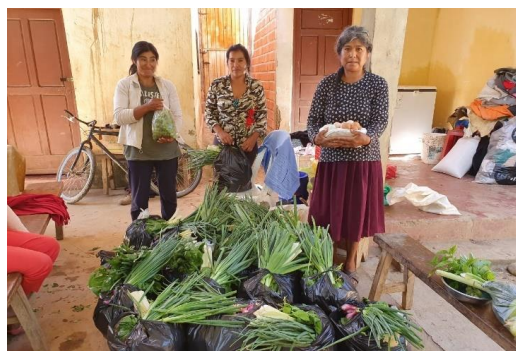
Imágen 5: Durante la pandemia de Covid-19, la Bioferia y Jaina organizaron un sistema de acopio comunal para abastecer a la Canasta Campesina (marzo de 2020).

Este sistema emergió paso a paso. Inicialmente se desarrolla una experiencia piloto en la primera semana, en coordinación con un miembro del Concejo Municipal. Él estaba preocupado en hacer llegar comida a un grupo de familias discapacitadas, que por su condición no podían movilizarse para conseguir comida. Como el equipo de investigadores no tenía un vehículo adecuado para el transporte, el concejal apoyó con la camioneta del Concejo Municipal, y él en persona se trasladó a la comunidad de Saladillo, donde las compañeras de la Bioferia esperaron con su producción acopiada, pero sin organizarla en paquetes familiares. El Concejal apoyó a las mujeres a armar las bolsas para cada familia, lo cual resultó siendo una innovación tecnológica crucial, ya que en adelante esa fue la modalidad y unidad de intercambio entre las familias de la ciudad y las comunidades.