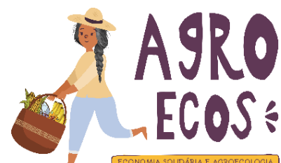
Imágen 1: Proyecto AgroEcos.

Estos esfuerzos también fortalecen las redes solidarias para enfrentar varias amenazas, que abarcan conflictos sociales internos y externos. Por sus propias capacidades colectivas, las redes solidarias pueden mejor luchar por políticas públicas favorables. Por ejemplo: servicios sociales, bienes comunes, capacitación y compras institucionales de alimentos agroecológicos.