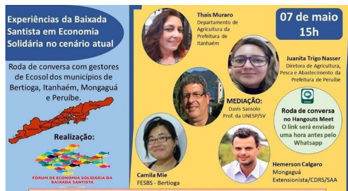
Imágen 3: Rueda de Conversación con hablantes de las Prefeituras, redes solidarias e iniciativas EcoSol, 07.05.2020.

Durante la pandemia la Livres ofreció la opción de retirar la cesta de alimentos directo de la sede o recibir una cesta en casa - sobre todo por los ecobikers, una cooperativa en base solidaria. La Livres Coop entonces recibió muchos pedidos para entregar – más del suministro de alimentos. Destaca ayuda mutua y trabajo voluntario, por ejemplo, para montar las cestas.