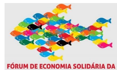
Imágen 2: Logo del FESBS

De esta manera el sujeto colectivo convirtió las dificultades en oportunidades. Nuevos participantes ayudaron a los productores asumiendo varios roles, por ejemplo, organizando donaciones de alimentos a personas vulnerables, gestionando pedidos, organizando cestas, distribuyéndolas, etc. Algunas iniciativas difundieron sus innovaciones, para que las redes de solidaridad pudieran replicar sus experiencias.