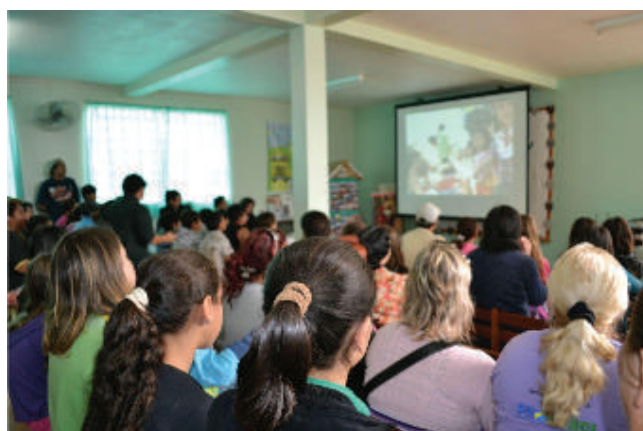
Figura 8 Atividades da Psicologia.