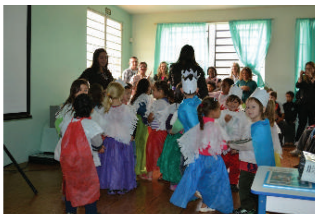
Figura 8 Apresentação folclórica das crianças.