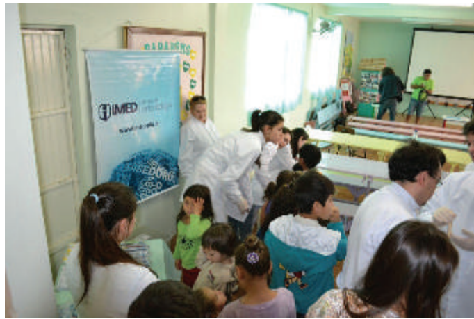
Figura 13 Atividades da Saúde.