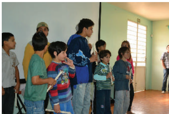
Figura 7 Apresentação de música e flauta doce.