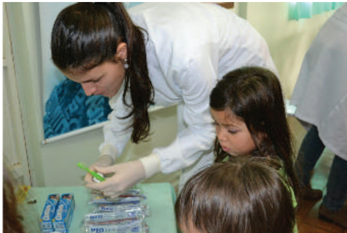
Figura 14 Atividades da Saúde.