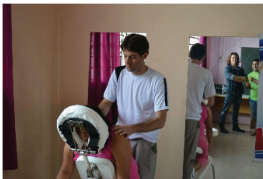
Figura 18 Atendimentos de fisioterapia.