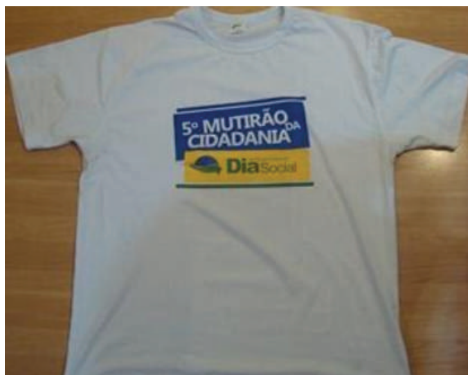
Figura 2 Camiseta do V Mutirão da Cidadania.