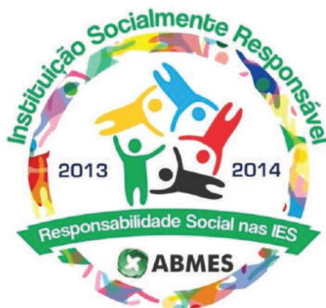
Figura 1 Selo de Instituição Socialmente Responsável - V Mutirão da Cidadania 2013.