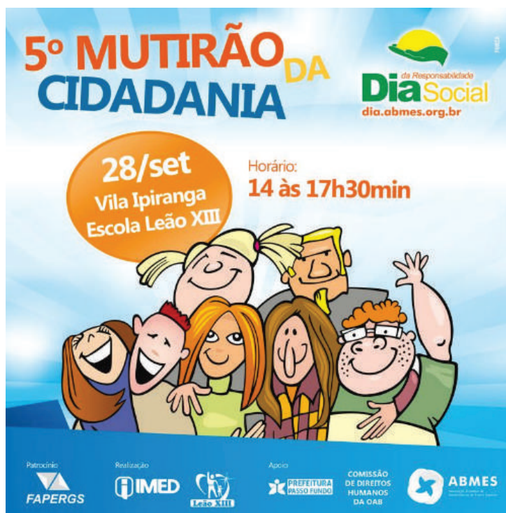
Figura 3 Imagem de propaganda do V Mutirão da Cidadania.