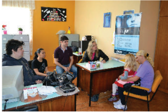
Figura 12 Palestras realizadas.