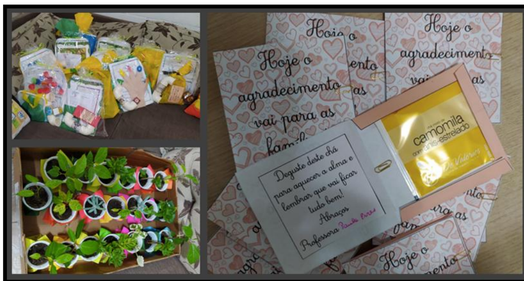
Figura 3 – Materiais enviados pela professora para as famílias