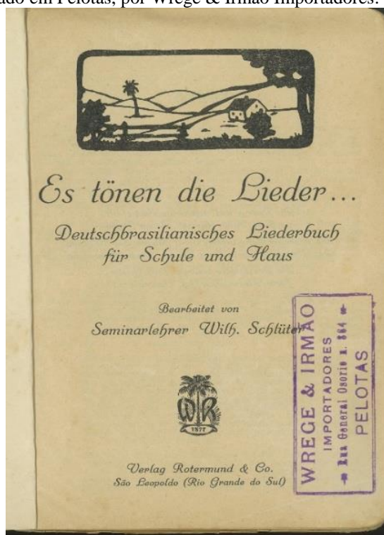
Figura 2 – Capa interna do livro de música: Es tönen die Lieder... Livro de Canções Teuto-Brasileiras para Escola e Casa Escrito pelo professor do Seminário 10 : Wilhelm Schlüter, em 1931. Comercializado em Pelotas, por Wrege & Irmão Importadores.