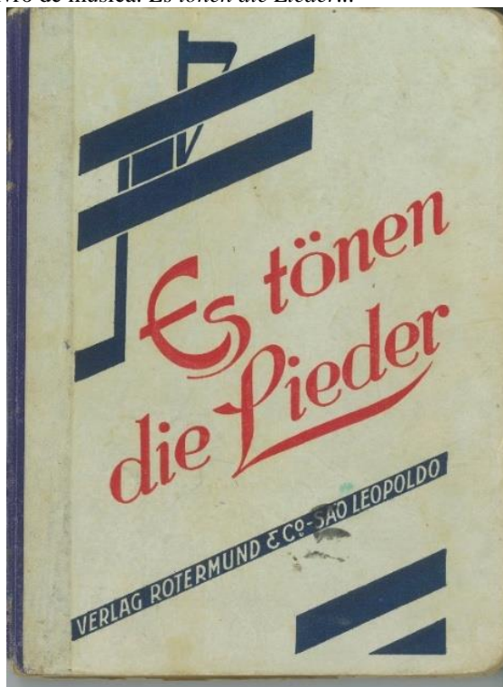
Figura 1 – Capa externa do livro de música: Es tönen die Lieder...

Para o que diz respeito ao material didático, Es tönen die Lieder... (Soam canções...) de Wilhelm Schlüter, escrito em 1931, (Figuras 1 e 2), as entrevistadas foram unânimes em mencionar e confirmar que usaram esse livro de música durante as aulas de canto. De acordo com a fala das entrevistadas das décadas de 1930 e 1940: “Usamos esse livro sim! Mas logo decorávamos as letras e as melodias. Usávamos muito a memória. Os cantos, todos de cor!”