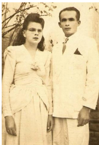
Imagem 4 - Casamento em 1948

Mesmo inserida nesse contexto, Ofélia namora um rapaz ex-combatente da Segunda Guerra Mundial, atuou como soldado da borracha, migrando para a região Norte na época da Guerra.